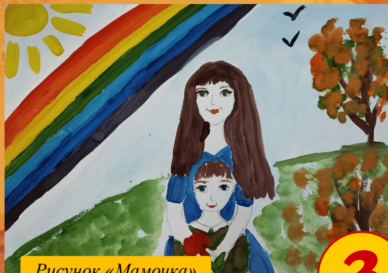
Рисунок «Мамочка» Ученики 2 кл.

Письмо от Анастасии Банкрутенко, 5 класс