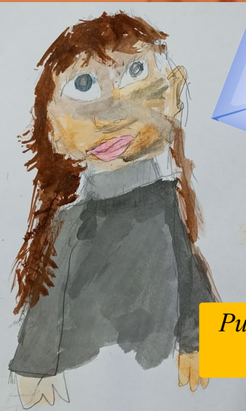
Рисунок «Мамочка» Ученики 2 кл.

Дорогая мама, в этот день чудесный, Хочу поздравить тебя с Днём Матери!